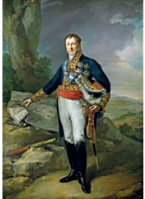
Pedro de Alcántara Álvarez de Toledo y Salm-Salm, XIII duque del Infantado. Obra de Vicente López Portaña. Museo Nacional del Prado.

A todo lo anterior se une una epidemia de tifus, que ocasiona un gran número de bajas y diezma a las tropas.