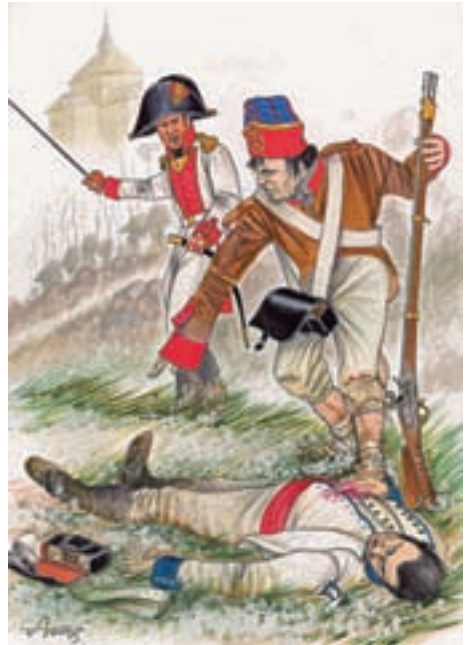
Oficial y soldado de la milicia Provincial de Cuenca, recogiendo los efectos personales de un camarada muerto del Regimiento de Órdenes Militares. Ilustraciones F. Vela.

Tras la estrepitosa derrota, los restos del ejército del Centro emprendieron la huida hacia Cuenca, continuando por el sur, perseguido sin tregua por el mariscal Víctor, que acaba con la pérdida de la artillería española en un combate en la localidad de Tórtola.