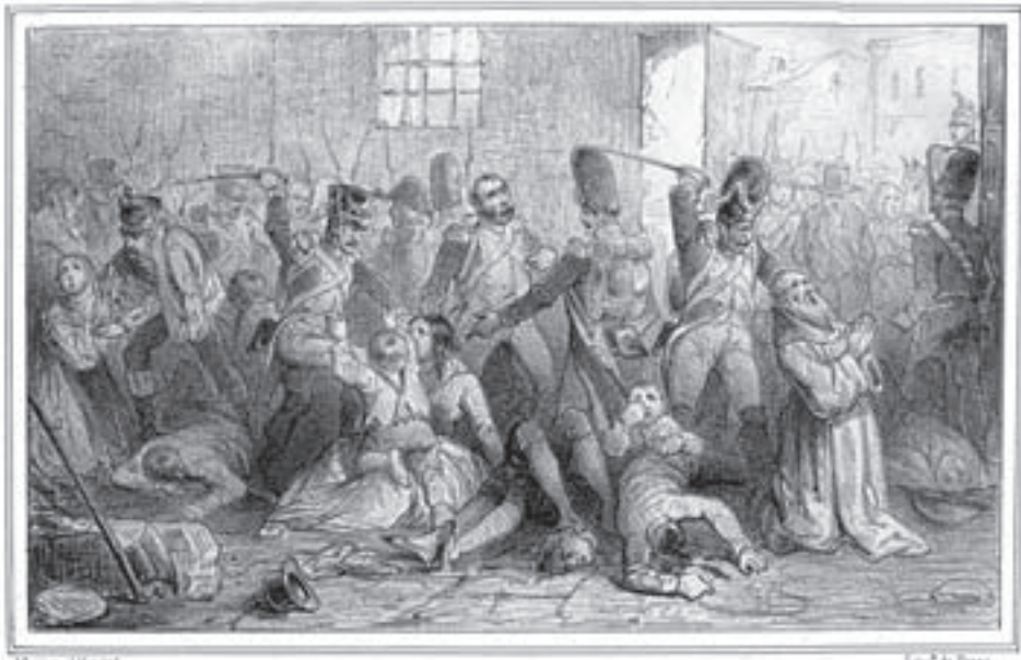
ATROCIDADES DE UCLÉS.