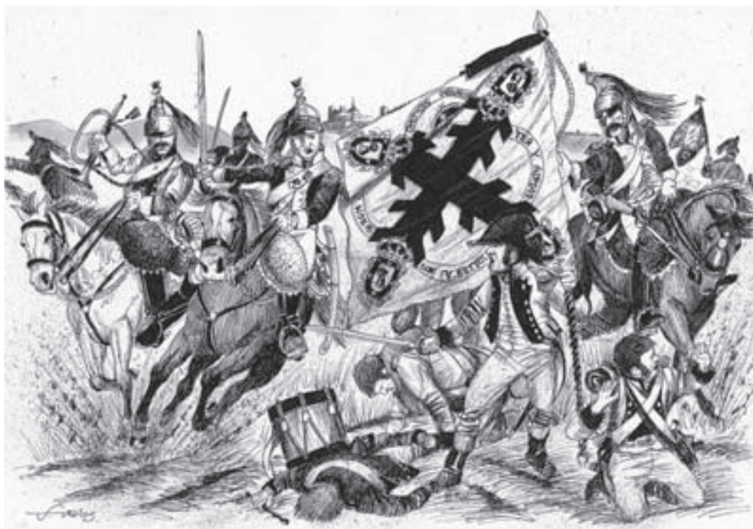
Los dragones de Latourg-Mabourg combaten en Tribaldos con los Voluntarios de Madrid. Plumilla de F. Vela.