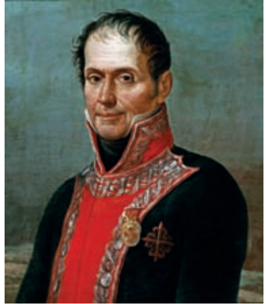
Francisco Javier Venegas de Saavedra. Obra de José Aparicio, 1815. Museo del Prado.

Retira su fuerza de Tarancón a media noche del día 11, bajo un fuerte temporal de lluvia y nieve, para dirigirse hacia Uclés. El día 12 se unen las tropas al mando de Senra, y se concentra así la división de Vanguardia en Uclés.