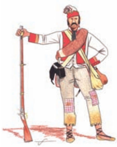
Voluntarios de Madrid Ilustraciones F. Vela

A la derecha con el mariscal de Campo Augusto Laporte: Ligero de Campo Mayor, Murcia de línea, Provincial de Toro, Voluntarios de Carmona, Reales Guardias Walonas, Granaderos Provinciales e Irlanda de línea.