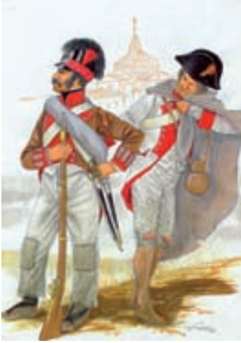
Fusileros Voluntarios de Sevilla (izda.) Regimiento Provincial de Cuenca (dcha.) Ilustraciones F. Vela