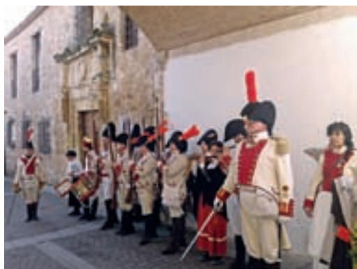
Homenaje a los caídos en la batalla.