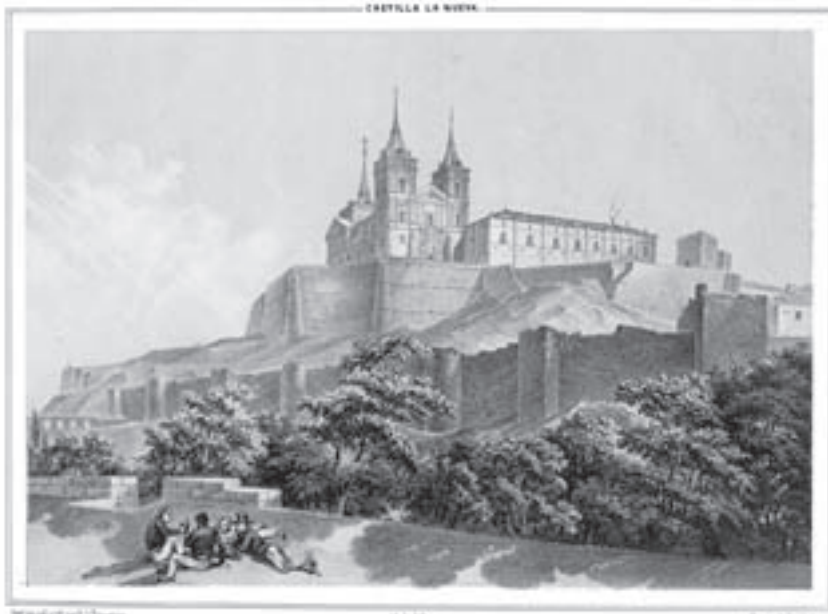
UCLÉS (Casa teatro de la orden de Santiago)